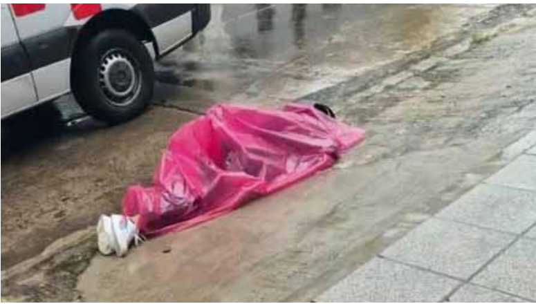
En El Palomar. Menor baleado

El abatido intentó robarle el auto. Es el cuarto menor de edad que falleció recientemente en circunstancias similares.