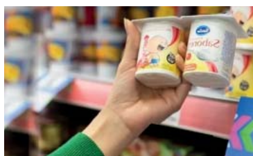
La industria láctea en crisis. Quebró la empresa ARSA