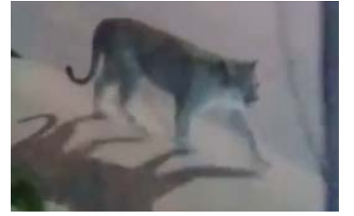
El puma en Valeria del Mar.

El ejemplar es de gran porte. Los especialistas recomiendan no intentar acercarse ni ahuyentarlo.