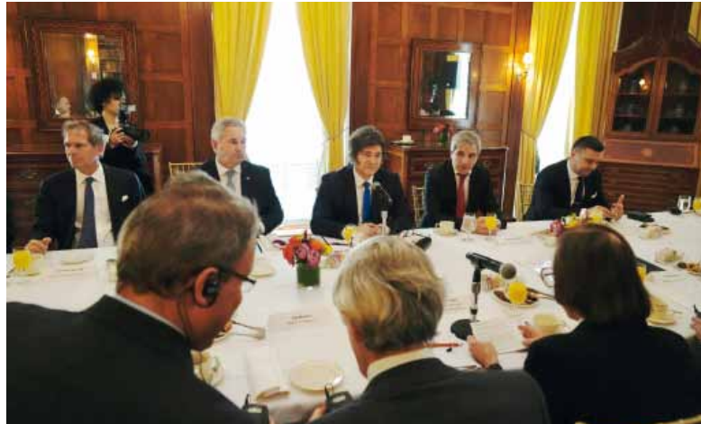
A empresarios. El presidente Javier Milei alentó a invertir en el país.

Durante casi media hora, Milei realizó una exposición en la que repasó los principales lineamientos de su plan económico y político. Luego, respondió preguntas de los empresarios, que consultaron sobre el rumbo del país, el tipo de cambio, la inflación y las perspecti-