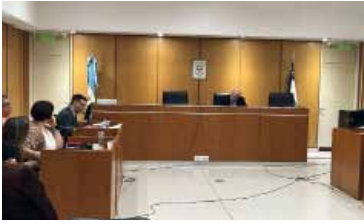
Audiencia. Para la nueva imputación

El defensor oficial se opuso a la decisión y pidió que se imple-