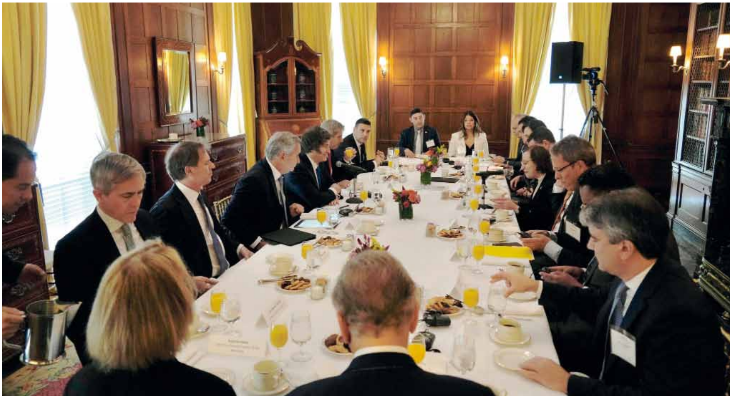
■ Milei se reunió en Manhattan con destacados empresarios estadounidenses

de estabilidad y crecimiento" tras su triunfo en las elecciones legislativas. La reunión se desarrolló durante una hora y media en la casona de Park Avenue, sede de la entidad. Página 3