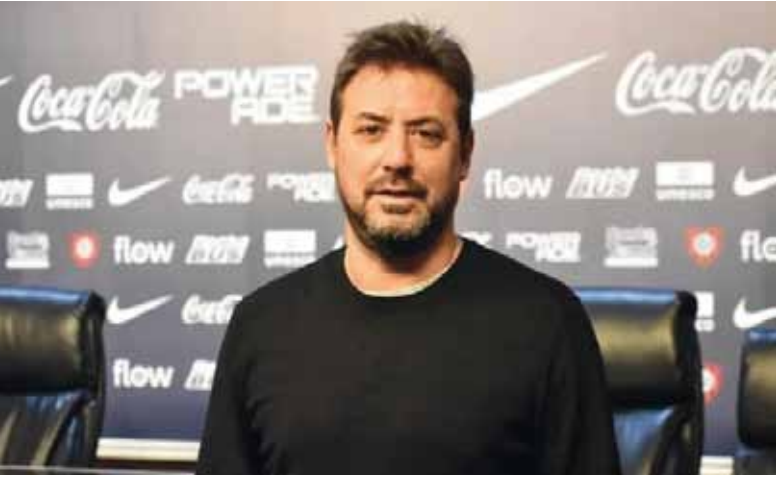
Reestructuración. El dirigente buscará poner orden institucional.