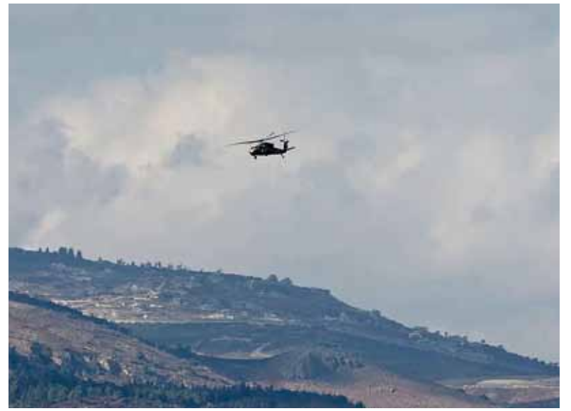
En conflicto. Líbano trata de expulsar a los israelíes.

El país intenta poner freno a la escalada israelí y también garantizar el repliegue de las fuerzas de Israel en su territorio.