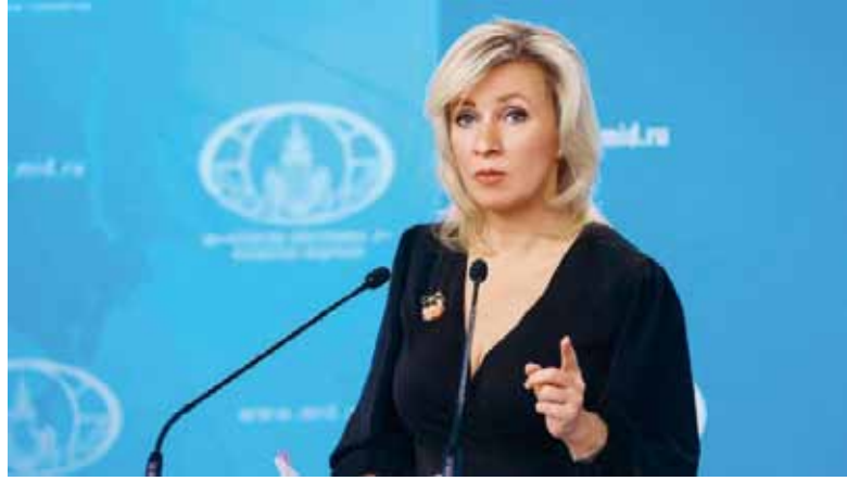
Portavoz rusa. María Zájárova.

Ella continuó: "Ciertamente, estamos siguiendo de cerca la evolución de la situación en la parte sur del Caribe, donde la situación sigue complicándose, lo que suscita una creciente preocupación por parte de los Estados de la región que, permítanme recordarles, en 2014 se proclamaron zona de paz". La funcio-