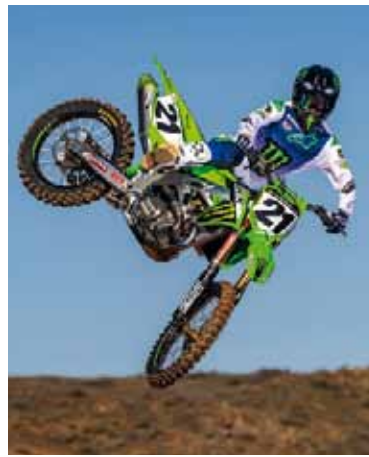
Vuelo. La etapa porteña será la primera de cinco fechas.

El evento incluirá competencias en las categorías SX1 (450 cc) y SX2 (250 cc). La edición 2025 incorporará, además, la primera participación oficial de motocicletas eléctricas, bajo un reglamento que equipará sus condiciones de competitividad con las de los modelos de combustión interna.