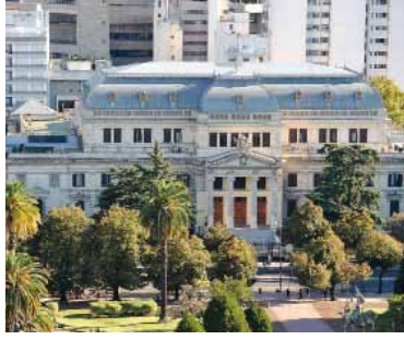
La Legislatura de la provincia de Buenos Aires.

Con la premisa que tiene el gobernador Axel Kicillof de que se apruebe el Presupuesto 2026, el financiamiento y la ley fiscal impositiva antes del recambio legislativo que se producirá el 10 de diciembre, la Cámara de Diputados bonaerense buscará desde la próxima semana comenzar a debatir esas herramientas claves para el gobernador.