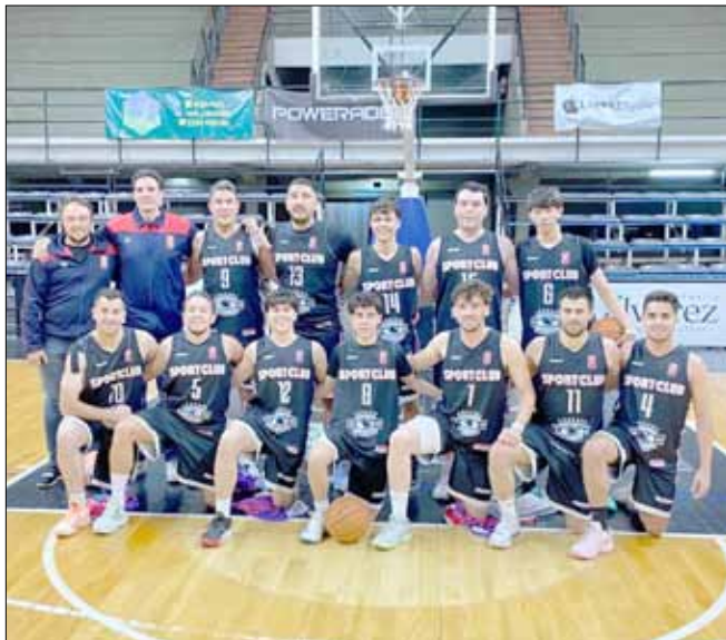
Sport tiene por delante un partido muy complicado para ser semifinalista, pero como local hizo su parte.

De esta manera, la serie entre Estudiantes y Sport Club Trinitarios es la única que resta definirse