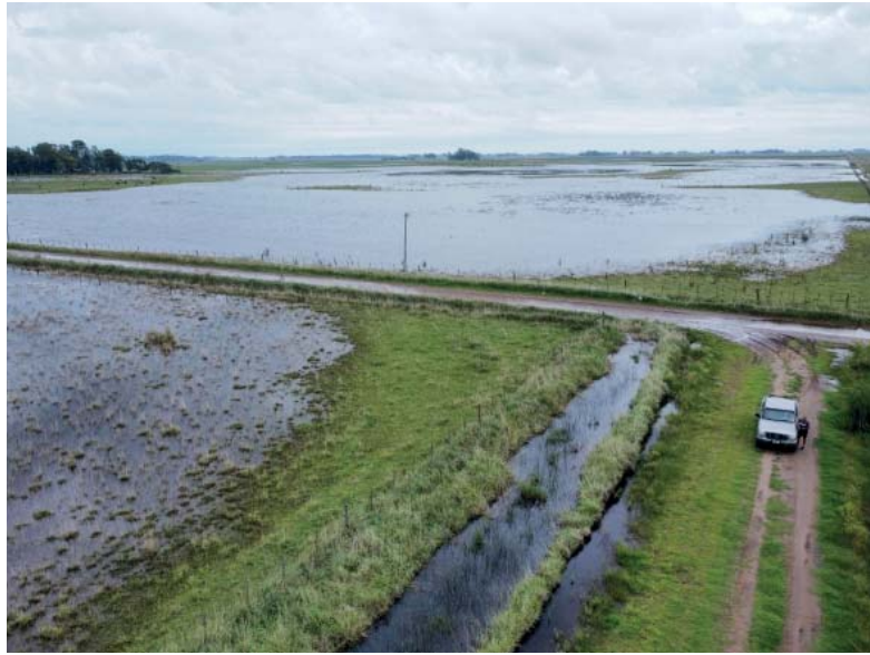
Drama. Un campo inundado en el corazón de la provincia de Buenos Aires.

Además, destacó que: “Estuvimos en Bragado y en 9 de Julio la semana pasada, cuando hemos