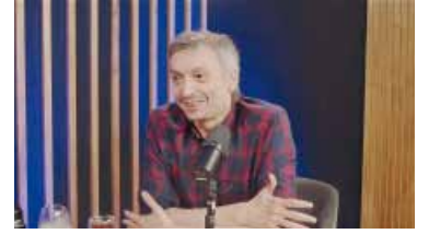
Kirchner espera sucesora.

Dos mujeres son candidatas a suceder a Máximo