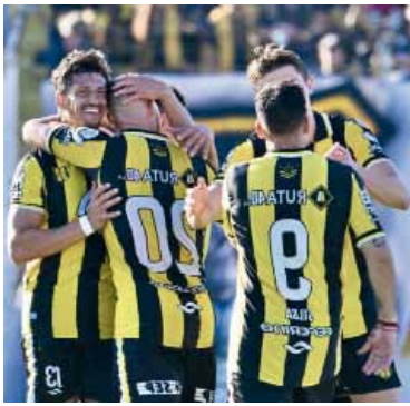
Candidato. Madryn parte como favorito para lograr el ascenso.